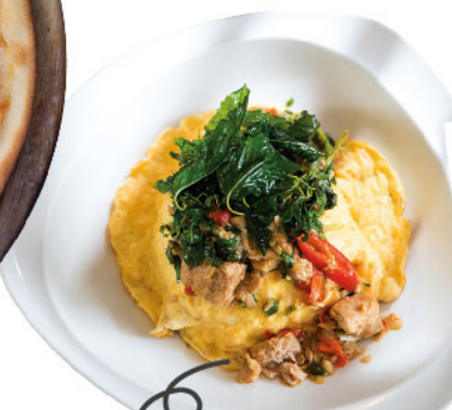
Omelette on Rice topped with Tuna and Spicy Basil leaves