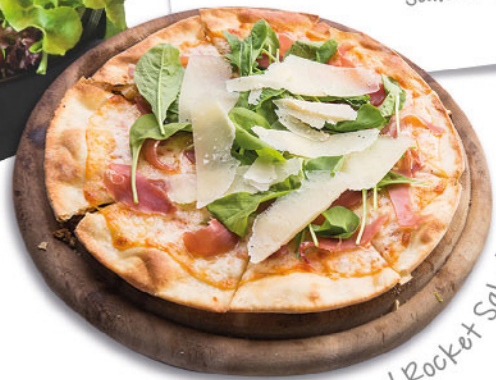
Parma Ham and Rocket Salad