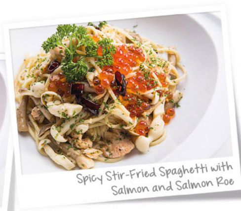
Spicy Stir-Fried Spaghetti with Salmon and Salmon Roe