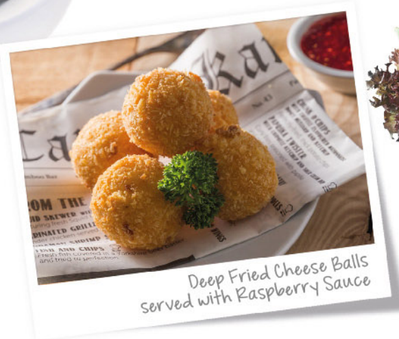
Deep Fried Cheese Balls served with Raspberry Sauce