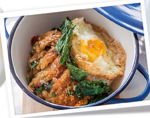
Crispy Pork Leg with Basil Leaves and Deep-Fried Egg